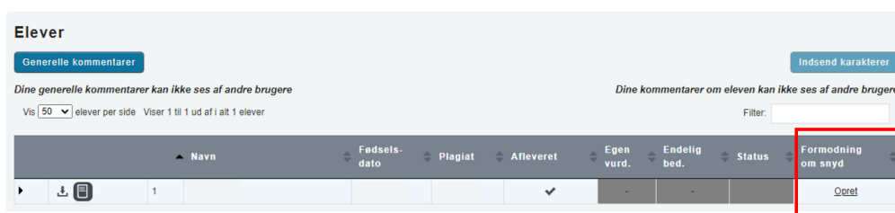
Figur 1: Skærmsprint med præcisering ift. oprettelse af formodning om snyd

Til orientering skal 'snydeblanketten' i Netprøver.dk godkendes af begge censorer, før den kan ses af institutionens eksamensansvarlige.