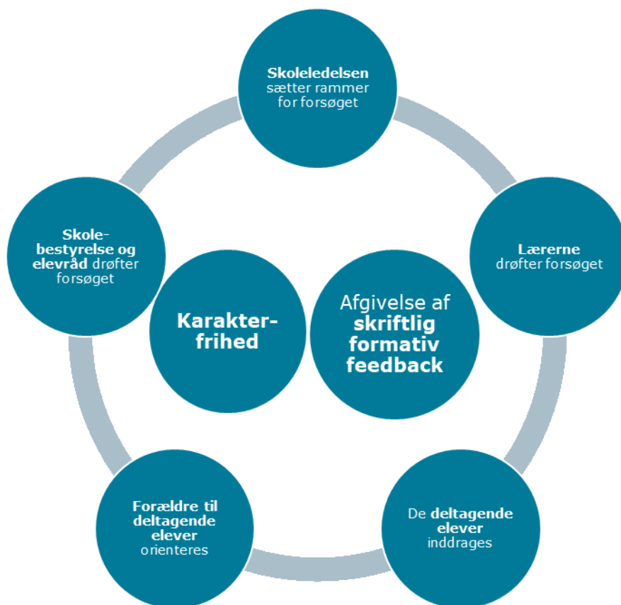
Figur 1: De syv kerneelementer

Forsøget handler om karakterfrihed og skriftlig formativ feedback. Disse to kerneelementer er derfor i centrum i figuren nedenfor. At forsøget bliver vellykket forudsætter en række andre aktiviteter, som derfor omgiver selve karakterfriheden og den skriftlige formative feedback. Kerneelementerne består af dialog mellem skolens forskellige aktører og har blandt andet til formål at udvikle den skriftlige formative feedback. De omkringliggende kerneelementer skal blandt andet bidrage til, at den formative feedback bliver så brugbar og motiverende for eleverne som muligt.