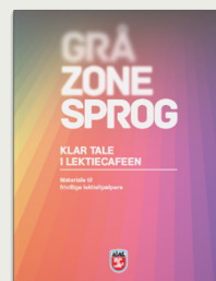
Gråzonesprog - Klar tal i lektiecafeen