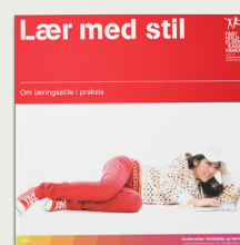
Lær med stil - om læringsstile i praksis