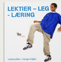
Lektier - leg - læring - Lektiecaféer i mange miljøer