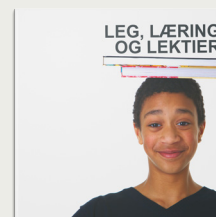
Leg, læring og lektier