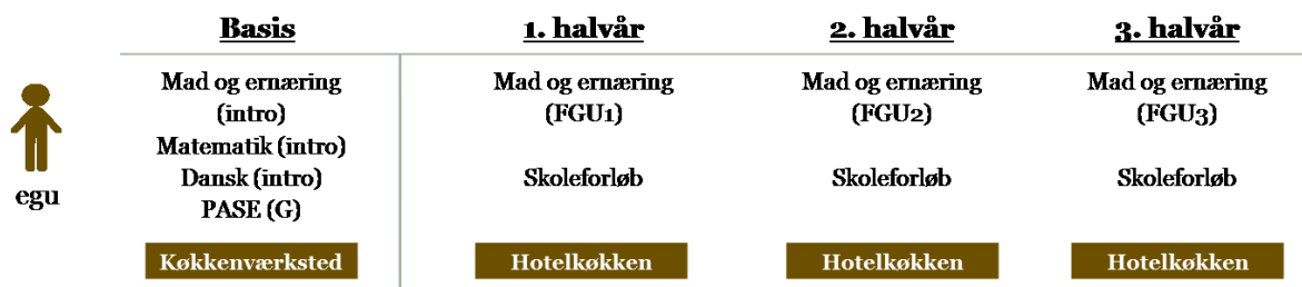
Figur 3. Eksempel på indholdselementer i elevforløb på erhvervsgrunduddannelse

I de faglige temaer for erhvervsgrunduddannelsen foregår undervisningen på tre niveauer; FGU 1, FGU 2 og FGU 3. Undervisningsniveauerne er indplaceret i forhold til kompetenceniveauerne i kvalifikationsrammen for livslang læring således, at FGU 1 svarer til kompetenceniveau 1, FGU 2 til kompetenceniveau 2 og FGU 3 til kompetenceniveau 3 i kvalifikationsrammen.