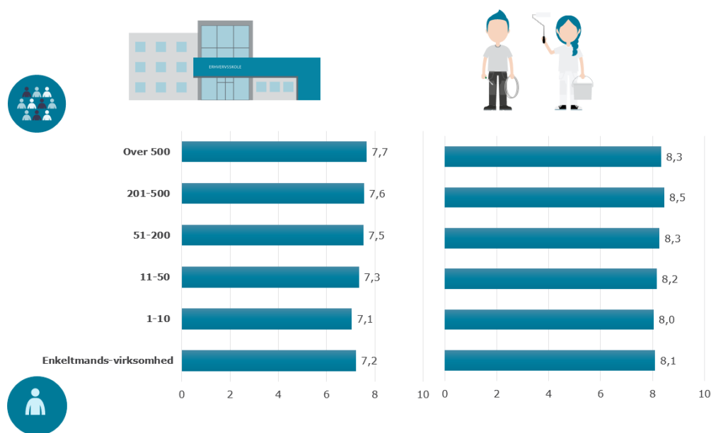
Figur 3 Virksomhedernes tilfredshed med skoler og elever i 2020 fordelt på antal ansatte