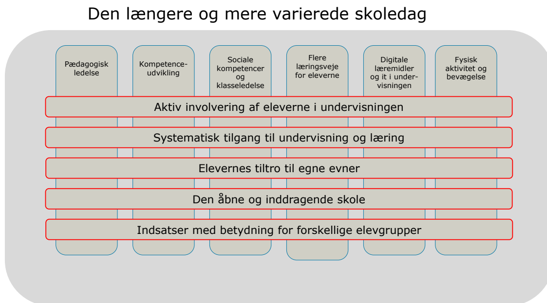
Figur 2: Sammenhæng i den tværgående analyse

Nærværende afsnit indeholder en analyse på tværs af de seks forskningskortlægninger og -syntheser. Figuren nedenfor illustrerer sammenhængen mellem de perspektivrige indsatsområder (afsnit 2.1) og kendetegn ved den gode indsats (afsnit 2.2).