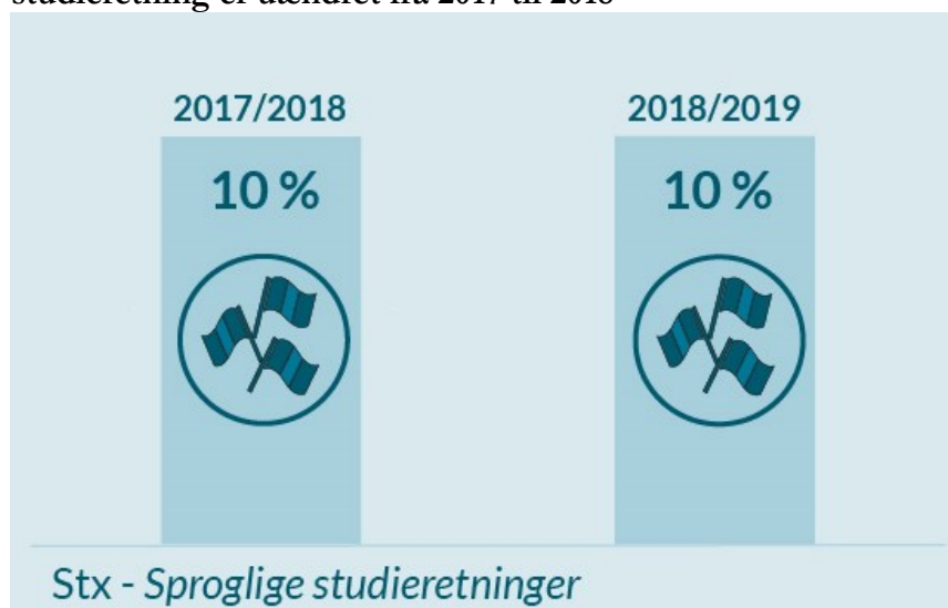
Figur 1: Andelen af stx-elever på 1. årgang med en sproglig studieretning er uændret fra 2017 til 2018